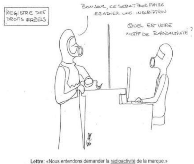
(2014) 26 :1 CPI XVIII