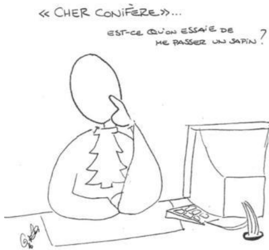
(2016) 28 :3 CPI XI