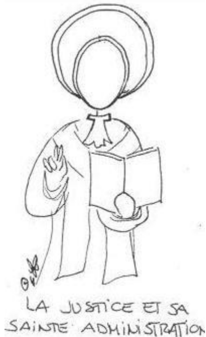
(2015) 27 :1 CPI XIII